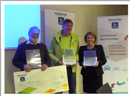
Ma fondation. Remise des prix à Besançon. 18 novembre 2015

Un chèque a ainsi été remis à notre Président. MERCI !